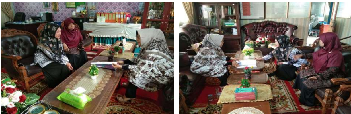
Gambar 1.2 : Kegiatan Supervisi Kepala Madrasah

Tampilkan foto foto kegiatan supervisi yang dilakukan Kepala Madrasah terhadap BK