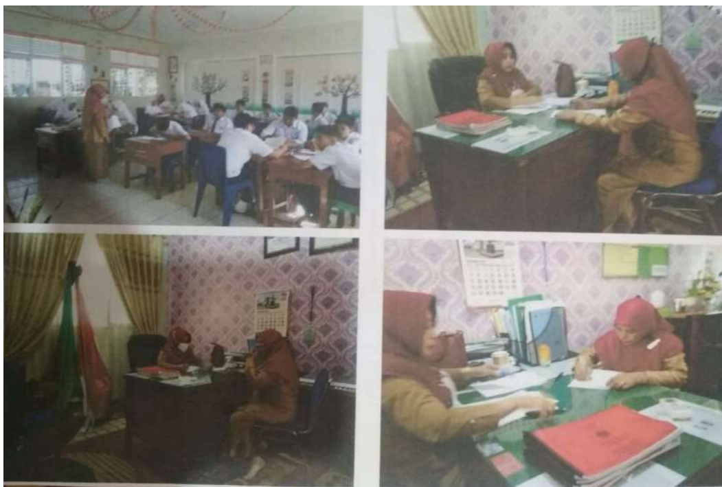
Gambar 1.1 : Konsultasi perencanaan pembelajaran tahun pelajaran 2018-2019 (Supervisi Kepala Madrasah)