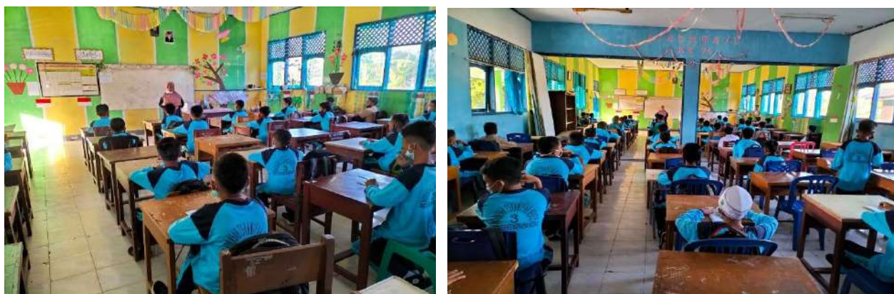
Gambar 1.3 : Kegiatan Belajar Mengajar di Kelas

Tampilkan Foto Foto Kegiatan PBM di Kelas